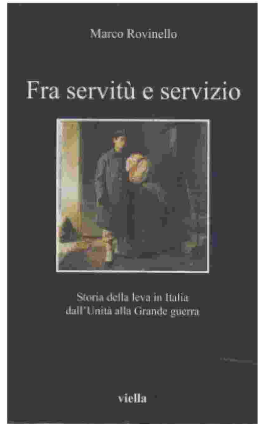
Copertine di volumi vincitori e finalisti